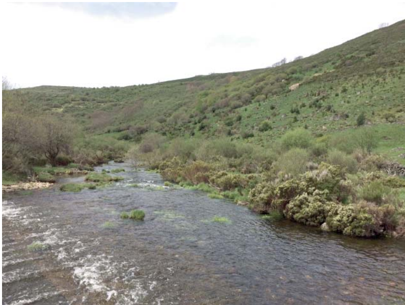
Fig. 1. Punto de muestreo en el río Bibey donde se han encontrado las larvas de P. replicata .

En la presente nota señalamos la presencia de dos larvas de Phalacrocera replicata (Linnaeus, 1758) en el río Bibey (Porto, Zamora). Las larvas aparecieron en la muestra de bentos tomada el día 23/05/2016, dentro de los trabajos de establecimiento del estado ecológico de los ríos de la Demarcación Hidrográfica del Miño-Sil. El punto de muestreo (Fig. 1) se sitúa a 1320 m de altitud ( datum ETRS89, huso 29T, 675877X; 4673018Y), correspondiente al tipo de río R-T27: ríos de alta montaña.